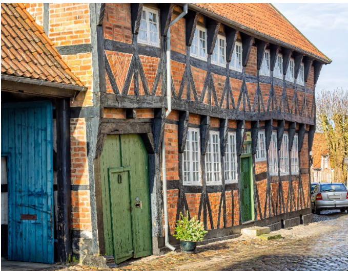
Fachwerkhaus in Ribe